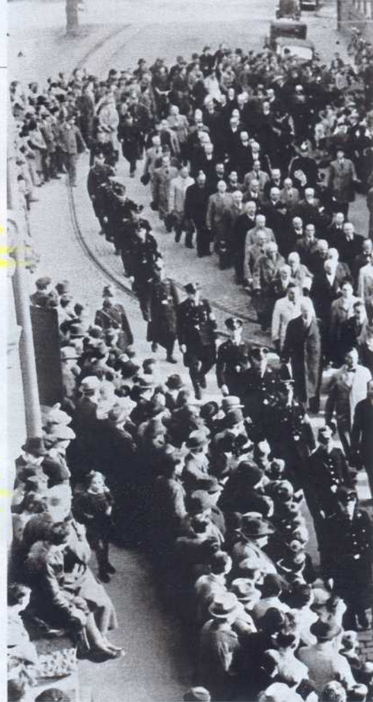
Nach der „Reichskristallnacht“ festgenommene

Juden. Es war das größte Pogrom der deutschen Geschichte seit dem Mittelalter, doch der Protest in der deutschen Öffentlichkeit richtete sich nur noch gegen die „Form des Kampfes gegen das Judentum“, wie die Kölner Gestapo notierte.