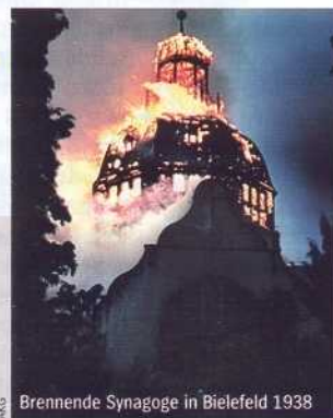
Brennende Synagoge in Bielefeld 1938

Himmler schlägt vor, alle Juden aus dem deutschen Machtbereich nach Afrika abzuschicken („Madagaskar-Plan“).