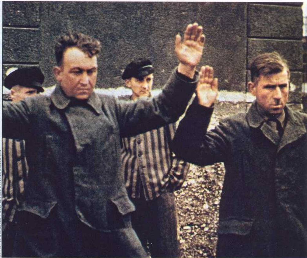
Gefangene SS-Wächter*: Herren über Leben und Tod

Das NS-Programm war so gigantisch, dass es erst allmählich in Gang kam, und es lief überall prinzipiell gleich ab. Juden