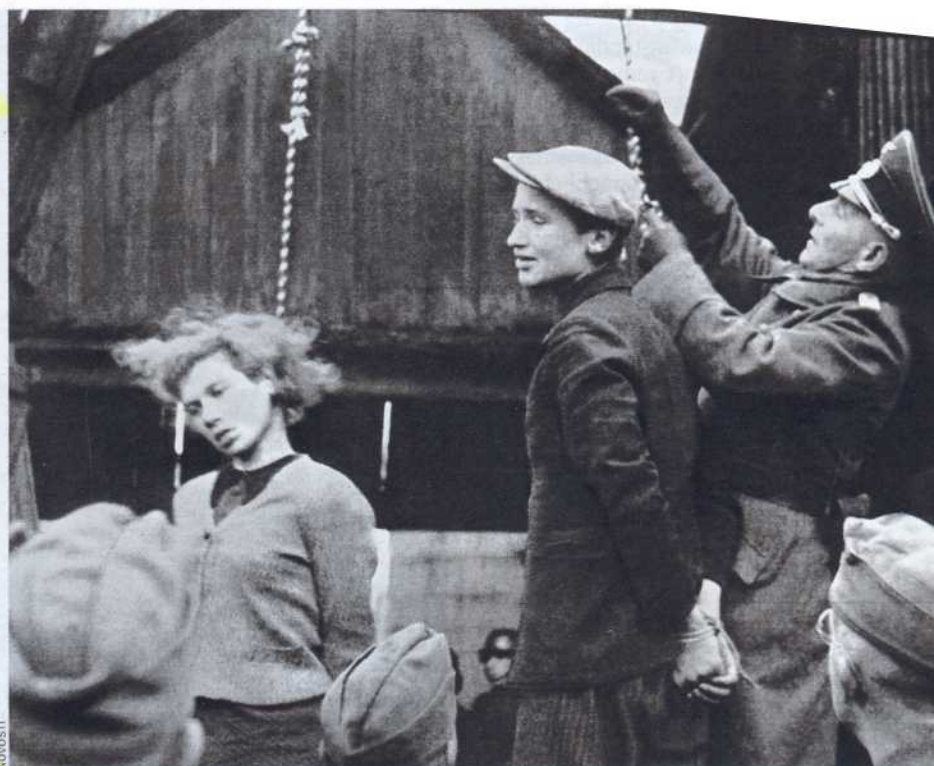
Exekution russischer Zivilisten (1941 in Minsk): Weder Mitleid noch Menschlichkeit

Auch viele seiner Untergebenen hader- n mit dem Auftrag, als im Wald das rschießen begann. Einige erklärten nach ner Weile, sie könnten nicht mehr, oder erwiesen darauf, dass sie selbst Kinder ätten. Mehrere Schützen stellten fest, dass sich unter den Opfern Juden aus amburg, Bremen oder Kassel befanden, nd gingen zu ihren Zugführern. Manche urden gleich abgelöst, andere bekamen nächst zu hören, sie könnten sich auch