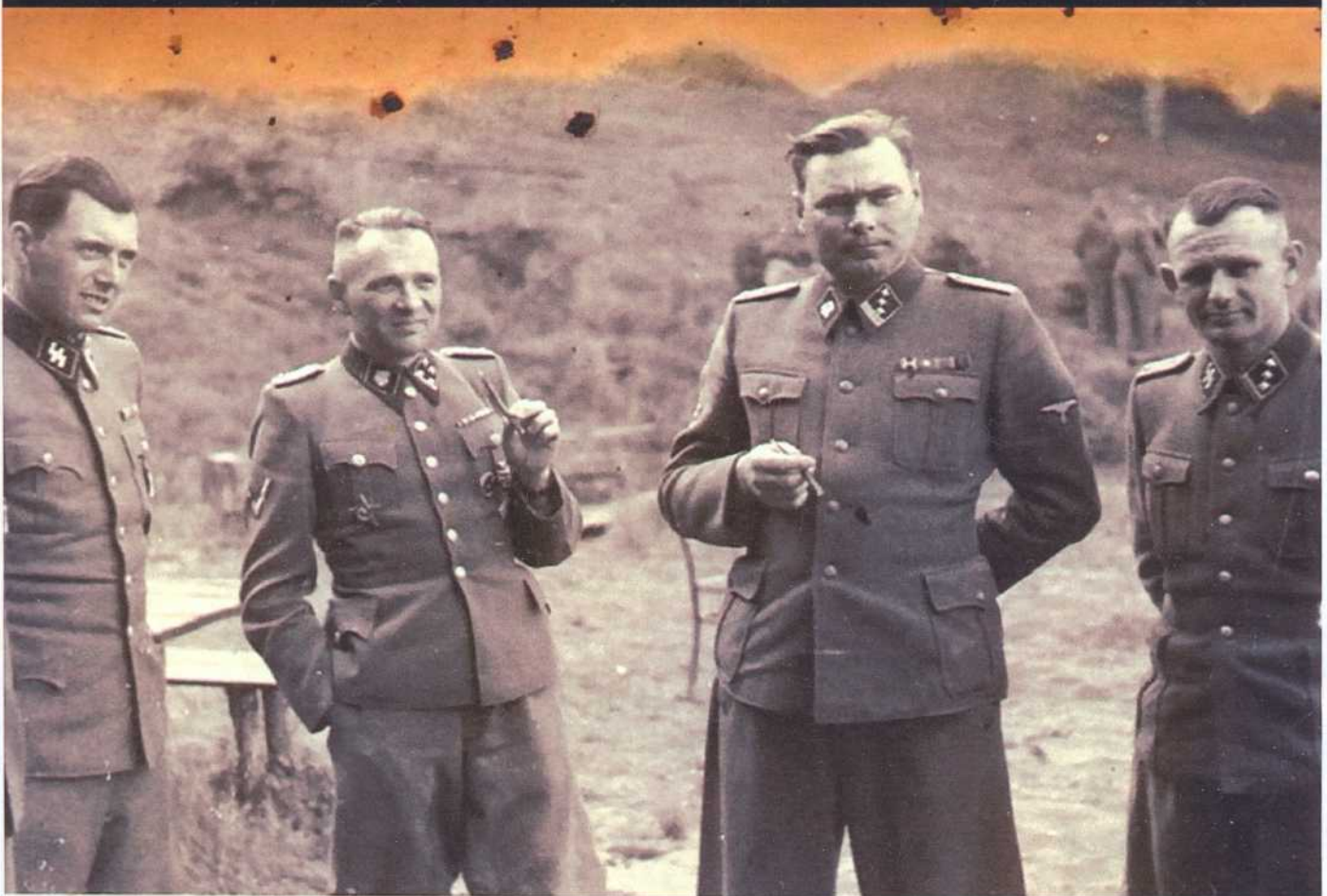
SS-Arzt Josef Mengele, Rudolf Höß (Kommandant des KZ Auschwitz), Josef Kramer (Kommandant des KZ Auschwitz-Birkenau) und ein nicht identifizierter SS-Obersturmführer 1944 im SS-Erholungsheim Solahütte

Warum so viele Deutsche zu Mördern wurden