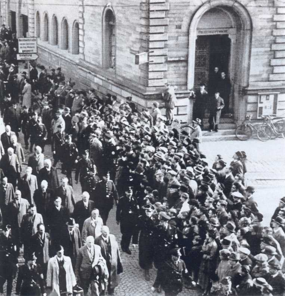
Juden*: Das größte Pogrom der deutschen Geschichte seit dem Mittelalter

den Staatsdienst zu verlassen, und es war ihnen verboten, die deutsche Flagge zu hissen. Die Wirklichkeit schien die Ideologie zu bestätigen: Weil Juden ausgegrenzt waren, wurden sie als nicht dazugehörig wahrgenommen.