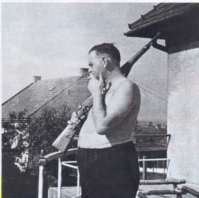
Lagerkommandant Göth*: Wahllos auf Häftlinge gezielt

Wie es sich denn anfühle, wenn man Massenhinrichtungen so detailliert schildere, wenn man am Schreibtisch im Blut der Opfer wate, wollte der deutsch-französische Intellektuelle und Politiker Daniel Cohn-Bendit bei Littells einzigem öffentlichen Auftritt vorletzte Woche in Berlin wissen. Der Autor antwortete ungerührt, dass