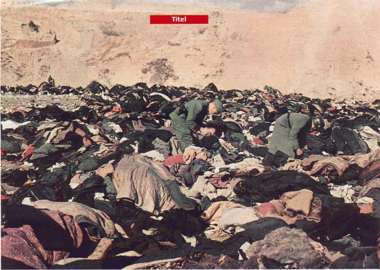
Kleiderberge nach der Massenexekution in der Schlucht Babi Jar 1941: 33771 Morde in 36 Stunden

die Leiche im Moment des Schreibens eine „grammatikalische Form“ sei – so wie für den Täter das Opfer im Moment der Tat zu einer bloßen Sache werde.