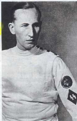
Holocaust-Planer Heydrich* Radikale Entschlossenheit

Um sie umzubringen, benötigte man die Hilfe der Wehrmacht, deren Offiziere oft ihrerseits den Mord an Juden forcierten, weil sie diese verdächtigten, Partisanen zu sein oder Partisanen zu unterstützen. Soldaten halfen beim Erfassen und Zusammentreiben der Opfer, sperrten die Hinrichtungsorte ab. Einige Einheiten morde-