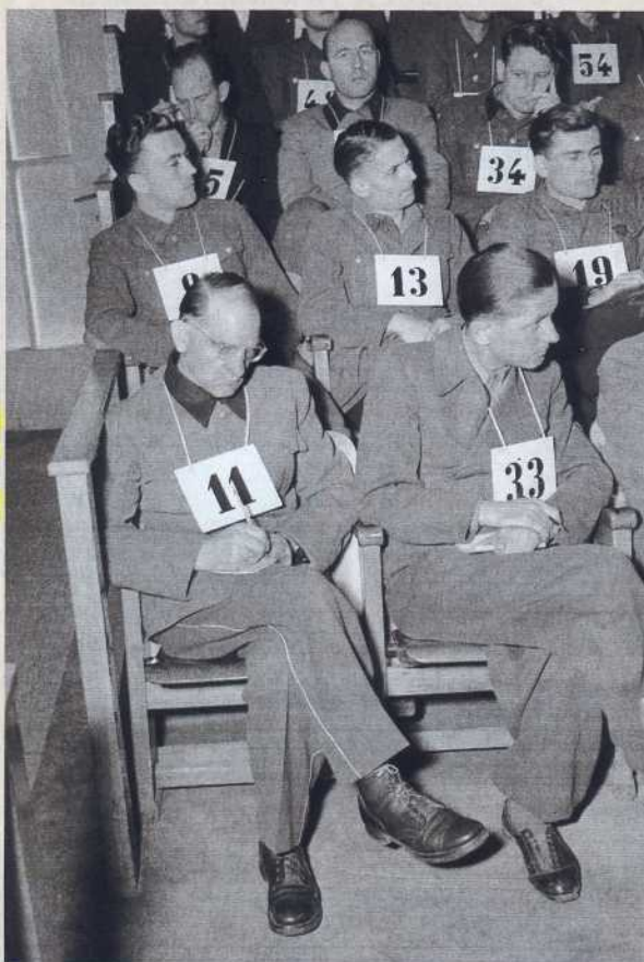
Angeklagte SS-Leute*: Amnesie und Amnestie

Das dürre Zahlenwerk der Berliner Justizministerialen weist 6498 bislang in der Bundesrepublik von deutschen Gerichten verurteilte Personen auf. 13-mal sprachen Richter, vor der Änderung des Grundgesetzes, die Todesstrafe aus, 167-mal lebenslange Freiheitsstrafe und 6201-mal Zuchthaus- oder Gefängnisstrafen. Etliche kamen mit einer Geldstrafe davon. Aber eben weniger als ein Fünftel der Täter waren Mörder und Totschlä-