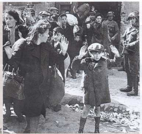
Deportation von Juden aus dem Warschauer Ghetto, 1943

Amerikanische Truppen befreien Buchenwald und bald darauf Dachau.